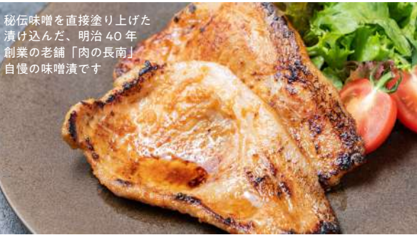
秘伝味噌を直接塗り上げた漬け込んだ、明治40年創業の老舗「肉の長南」自慢の味噌漬です